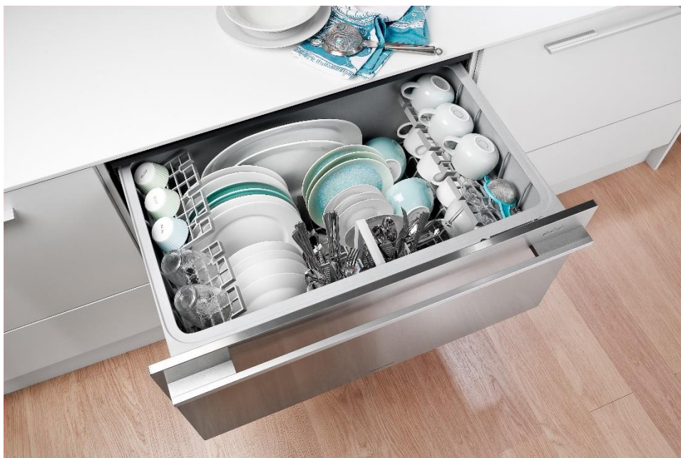
DishDrawer® LARGE Designer – la version XL du modèle simple tiroir

* programmes : rinçage, délicat, rapide, intensif, normal + fonction Eco